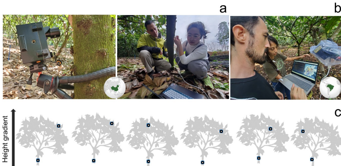
Abb. 3 Schematisch Übersicht über den Versuchsaufbau im AB II mit EcoEye-Kameras. Dabei werden an sechs Kakaobäume jeder Cabruca-Untersuchungsfläche zwei Kameras in verschiedenen Höhen (< 1m und >3m) angebracht, um die Bestäuber zu erfassen.

Für das Monitoring der Vögel und Fledermäuse werden 6 Kameras pro Cabruca-Plot aufgestellt, was insgesamt 180 zufällig gewählte Kamerastandpunkte ergibt. Die Kameras werden über zwei verschiedene Höhen verteilt (drei Kameras auf niedriger Höhe = <3 m und drei Kameras auf hoher Höhe => 5 m), um einen Höhengradienten zu erhalten und die Auswirkungen der vertikalen Struktur der Cabrucas auf Schädlinge, Herbivore und Prädatoren zu erfassen. Um Blütenbestäubung und Schädlingsbefall zu korrelieren, wird die Fruchtentwicklung an allen 6 untersuchten Kakaobäumen pro Plot erfasst. Dabei wird die Gesamtzahl der offenen Blüten pro Baum markiert und gezählt. Dann wird 48 h nach der Markierung der Blüten der Bestäubungserfolg erfasst. Schließlich wird die Fruchtentwicklung (d. h. Fruchtwelke, Schädlinge und Krankheiten, gesunde Früchte) der bestäubten Blüten jeden Monat bis zur Ernte verfolgt und die Erträge (das Trockengewicht der Kakaobohnen) quantifiziert.